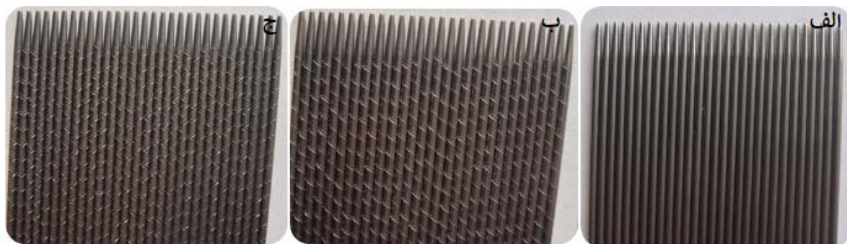
شکل ۲: شانه‌های استیل مخصوص ضد شپش؛ الف) Plain needle، ب) Screw needle و ج) Double strip needle

۳. لوسیون لیندان: این دارو به‌طور مستقیم توسط انگل‌ها و تخم‌ها جذب می‌شود، سیستم عصبی را تحریک می‌کند و باعث تشنج و مرگ سلول‌های انگلی می‌شود. ۱۳ در منابع، استفاده‌ی موضعی از لیندان به دلیل عوارض جانبی، دیگر جایگاهی ندارد؛ با این وجود لوسیون لیندان با ماده‌ی مؤثره‌ی گاما بنزن هگزا کلراید در حجم‌های ۶۰ سی‌سی به بازار عرضه می‌شود و البته این محصول دارای شانه نیست.