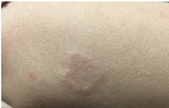
شکل ۲: پلاک آنولر متشکل از پاپول‌های کوچک و سفت در ساعد راست

گرافی با اشعه‌ی ایکس نشان‌دهنده‌ی تورم بافت نرم انگشت شست راست بود (شکل ۳). بیوپسی از ضایعه‌ی شست دست راست نشان داد که در درم پاپیلاری نواحی متعدد از رشته‌های کلاژن تخریب‌شده (نکروبیوزیس) که توسط سلول‌های التهابی هیستوسیت و لنفوسیت احاطه شده بود، مشهود است. هم‌چنین رسوب فوکال موسین در درم گزارش شد (شکل ۴). با توجه به مجموع یافته‌های آسیب‌شناسی، تشخیص بیماری گرانولوم آنولر زیرجلدی برای این بیمار مطرح گردید.