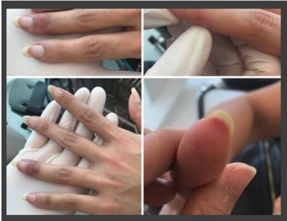
شکل ۷: راش ماکولوپاپولر در دو بیمار کووید ۱۹ بدون علائم تنفسی و تب