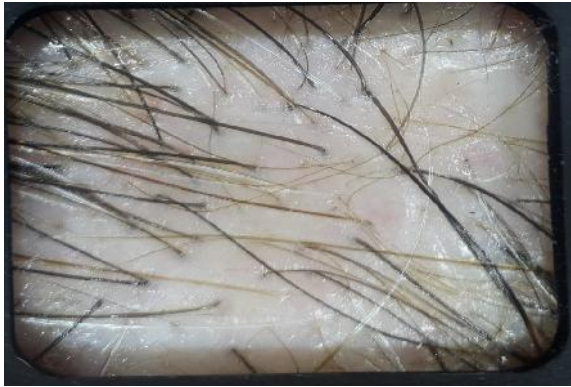
شکل ۱: تفاوت (هتروژنیته) در ضخامت ساقه‌ی مو در آلوپسی آندروژنتیک