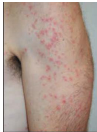
شکل ۸: خارش شناگر

درمان‌های موضعی می‌توانند سبب ACD پا شوند. از بیمار بپرسید آیا از دارو برای پا استفاده می‌کند یا بوگیر را داخل کفش اسپری می‌کند؟ بنزوکائین و لانولین موضعی که در بسیاری از داروها و کرم‌ها استفاده می‌شوند شایع‌ترین علت ACD در پاها گزارش شده‌اند.