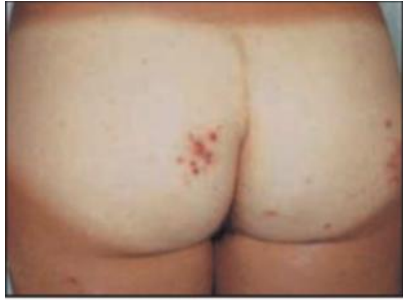
شکل ۱۰: Bikini bottom