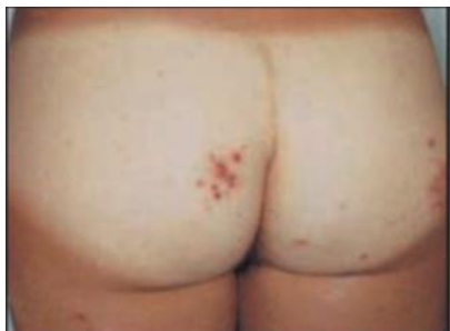
شکل ۱۰: Bikini bottom