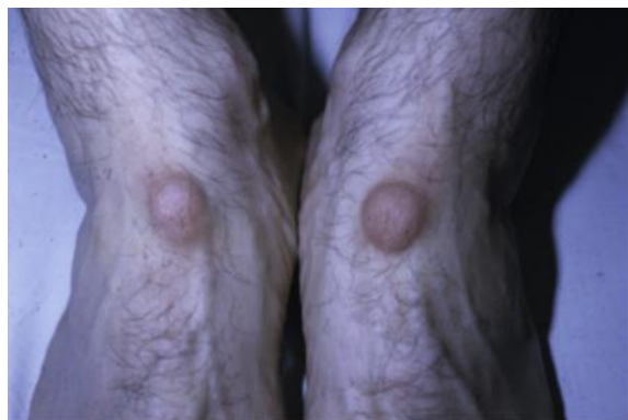
شکل ۴: ندول ورزشکاران

هیچ درمانی برای محافظت در هنگام فعالیت ورزشی مطلوب و قابل پذیرش نیست. اگر دردناک یا علامت‌دار باشد، برداشتن جراحی یا لیزر امکان‌پذیر است. استفاده از کرم اوره یا اسید سالیسیلیک برای نرم و از بین بردن بافت کراتینه شده می‌تواند مفید باشد از تزریق استروئیدهای داخل زخم نیز در گذشته استفاده می‌شده است اما معمولاً لازم نیست.