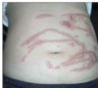
شکل ۶: گزش عروس دریایی

گزش عروس دریایی یا man-of-war stings به‌طور عادی در بین شناگران آب شور دیده می‌شوند و می‌توانند در سواحل هم وجود داشته باشند (شکل ۶). بیش از ۱۰۰ عروس دریایی سمی وجود دارد و علائم گزش از سوزش و خارش آزاردهنده تا مرگ متغیر است. شایع‌ترین تظاهرات پوستی، سوزش فوری و به‌دنبال آن ضایعات کهیری در یک توزیع خطی است. گاهی اوقات، ممکن است ضایعات گرانولوماتوز ایجاد شود و هفته‌ها تا ماه‌ها ادامه یابد.