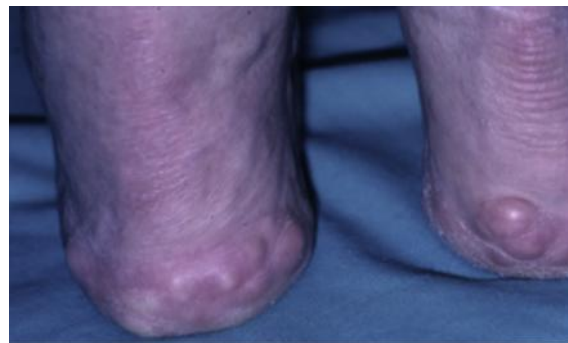
شکل ۲: پاپول‌های پیروژنیک (فتق جلدی)

التهاب پوستی سایشی نوک پستان که به دلیل تکراری بودن اصطکاک پیراهن ورزشکار روی نوک سینه‌های بیرون زده ایجاد می‌شود. در هنگام دویدن مردانی که به مدت طولانی پارچه‌های سخت مانند