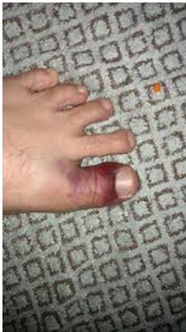
شکل ۳: پنجه چمن