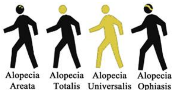
شکل ۲: برخی از انواع مهم آلوپسی