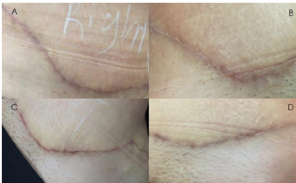
شکل ۲: ظاهر اسکار ابدومینوپلاستی در خانم ۴۶ ساله؛ (A) سمت شاهد در پایان هفته سوم پس از جراحی، (B) سمت شاهد در ویزیت نهایی، (C) سمت لیزر تراپی در پایان هفته سوم پس از جراحی، (D) سمت لیزر تراپی در ویزیت نهایی.

بهبود ظاهر اسکار مؤثر است اما باید مطالعات بیشتری در این زمینه انجام شود. ۱۳،۱۴