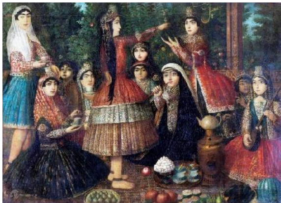
شکل ۴: بزم عصرائه زنان خضاب‌شده در دوره قاجار، موزه ویکتوریا و آلبرت.

قبل از استعمال آن موها یا ریش را با آب صابون تندی کاملاً شست‌وشو می‌دهند تا چربی‌هایی که از عرق ریختن تولیدشده، زدوده شود. آن‌گاه مقدار زیادی آب گرم روی سر می‌ریزند تا صابون‌ها پاک شود، سپس تا آن‌جا که ممکن است ریش و مو را خشک می‌نمایند. در این حال خمیر را بر روی قسمت‌های موردنظر می‌گذارند به طوری که تمام موها را آغشته می‌کند و می‌پوشاند. وقتی که از این امر فارغ شدند، دلاک‌ها عملیات استحمام را به شرحی که گذشت شروع می‌کنند. کار کیسه کشیدن که همیشه یک ساعت و نیم تا دو ساعت طول می‌کشد برای این‌که موها به خوبی رنگ بگیرند کاملاً کافی است. سرانجام این خمیر را با آب گرم می‌شویند و با شانه ظریفی شانه می‌کنند تا آن مقدار خمیری که هنوز در موها باقی مانده است، خارج شود.