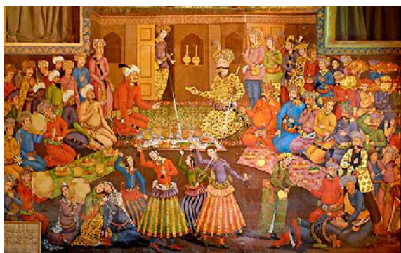
شکل ۲: ترسیم از ایرانیان خضاب‌شده در دوران شاه عباس کبیر در مجلس شاهی.

گاسپار دروویل، صاحب منصب نظامی و سفرنامه‌نویس فرانسوی است که در سال‌های ۱۸۱۳-۱۸۱۲ در پانزدهمین سال سلطنت فتحعلی‌شاه قاجار و ولایت‌عهدی عباس میرزا در ایران اقامت داشته است.