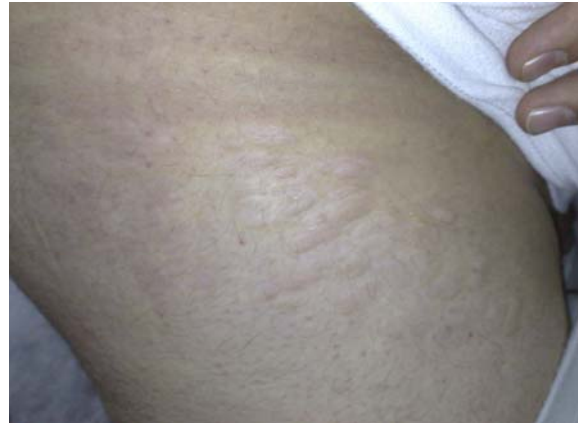
شکل ۱: ضایعات جلدی بیمار

اندازه کوچکی داشته و روی اندام‌ها ایجاد می‌شوند و نیز retiform که بزرگتر بوده و معمولاً روی تنه ایجاد می‌شوند تقسیم می‌شوند. ۴ با توجه به این موارد مورد معرفی شده در این گزارش یک فرم ایزوله خال بافت همبند را نشان می‌دهد که با اختلالات سیستمیک همراهی نداشته و سابقه خانوادگی نیز ندارد و لذا یک فرم غیروراثتی به‌شمار می‌رود.