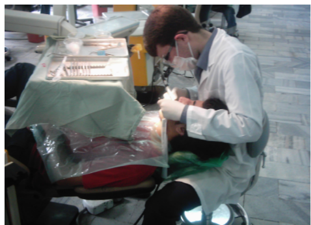
شکل ۴- نمونه‌ای از وضعیت بدن دانشجویان در حین انجام کار به وضعیت گردن که از حالت طبیعی خارج شده توجه کنید.

نمودار ۱- توزیع فراوانی افراد در سطوح خطر براساس جدول امتیازات نهایی REBA قبل و بعد از آموزش نشان دهنده بهبود عمومی و کاهش تعداد افراد در سطح خطر بالا و اضافه شدن آنها به تعداد افراد دارای سطح خطر پایین و متوسط