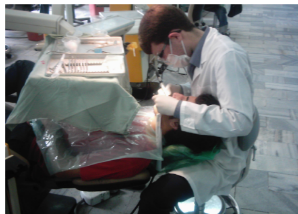
شکل ۴- نمونه‌ای از وضعیت بدن دانشجویان در حین انجام کار به وضعیت گردن که از حالت طبیعی خارج شده توجه کنید.

این روش در یک مشاهده کوتاه مدت می‌تواند پوسترچر افراد را ارزیابی کند. در این روش قسمت‌های مختلف بدن برای آنالیز در دو گروه A و B قرار می‌گیرند. در گروه A پوسترچر تنه، گردن و پاها قرار می‌گیرند. مقدار بار و نیرو نیز ثبت می‌شود. در گروه B بازوها، ساعد و نحوه اتصال دست با وسیله قرار دارند. این اطلاعات توسط روش مشاهده مستقیم به دست می‌آید. زمان مشاهده برای هر پوسترچر کاری ۳۰ دقیقه می‌باشد. برای ارزیابی دقیق‌تر از هر پوسترچر کاری یک یا چند عکس تهیه می‌شود (شکل ۴). پس از بررسی پوسترچر افراد، نمره نهایی REBA به دست می‌آید که عددی بین ۱ تا ۱۵ برای هر سمت بدن می‌باشد. بر اساس این نمره پوزیشن فرد به ۵ رتبه تقسیم می‌شود که بر اساس آن سطح خطر و میزان نیاز به اصلاح پوزیشن فرد تعیین می‌شود. به طور مثال اگر پوزیشن فرد به گونه‌ای باشد که نمره آن ۱۲ باشد، این فرد در سطح خطر بالایی از لحاظ ابتلا به بیماری‌های اسکلتی عضلانی قرار دارد و نیاز فوری به اصلاح وضعیت بدن خود در حین کار دارد.