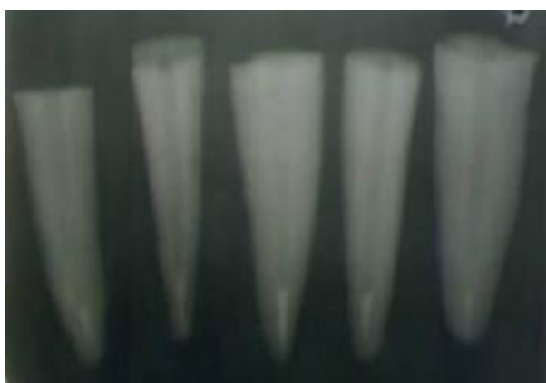
شکل ۱-تهیه رادیوگرافی جهت بررسی کیفیت پلاگ MTA

دندان‌ها به ۴ گروه ۱۰ تایی تقسیم شدند. در گروه ۱، تمام طول کانال به روش تراکم جانبی با گوتاپرکا و سیلر AH26 پر شد. سپس با استفاده از اینسترومنت داغ ۱۰ میلی‌متر گوتای کروئال تخلیه و قسمت آپیکال به وسیله پلاگر تراکم شد به گونه‌ای که پلاگ آپیکالی به ضخامت ۵ میلی‌متر باقی بماند. در گروه ۲، ۳ و ۴ به ترتیب ناحیه آپیکال به صورت مستقیم (دسترس تاجی) با استفاده از Pro root