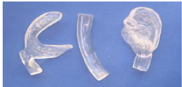
شکل ۲ - گوش آکریلی سمت چپ، بار آکریلی و رکورد اکلوژالی آکریلی