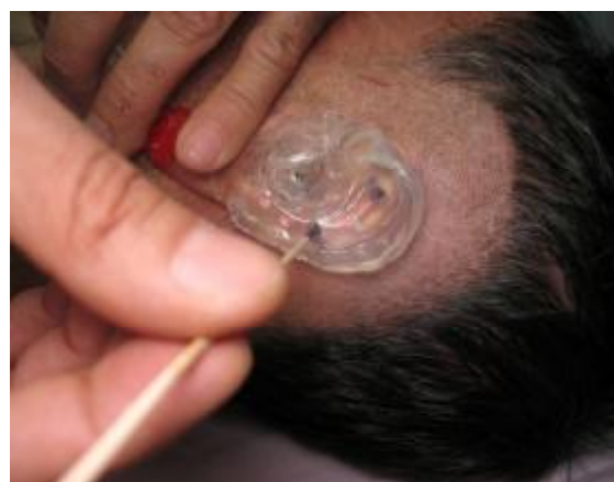
شکل ۷- استفاده از استنت حین جراحی