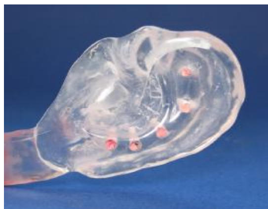
شکل ۵- ایجاد ۵ عدد سوراخ در ناحیه آنتی هلیکس استنت