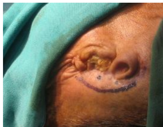
شکل ۸- نواحی علامتگذاری شده با متیلن بلو بر روی پوست

پروتزهای جایگزین گوش می‌توانند نتایج زیبایی خوبی به همراه داشته باشند. متأسفانه استفاده از مواد آدهزیو به دلیل وجود مو و فقدان ناهمواری آناتومیک، نتیجه مطلوبی نمی‌دهد. استفاده از ایمپلنت‌های ماگزیلوفیشیال، در بازسازی ضایعات خارج دهانی می‌تواند نقش مهمی در بالا بردن سطح کیفیت زندگی بیماران داشته باشد. با توجه به محدودیت کمی و کیفی استخوان در ناحیه ضایعه، باید طرح درمان مناسبی برای بیماران، بر اساس استنت دقیق رادیوگرافی و جراحی در نظر گرفته شود. دقیق بودن استنت، تثبیت موقعیت آن بر اساس نواحی آناتومیک ثابت و غیر متحرک است. بر اساس مطالعات انجام شده توسط محققین مختلف (۵-۸) نتایج درمان پروتزهای گوش متکی بر ایمپلنت کاملاً رضایت بخش بوده است. در مطالعه انجام شده توسط Roumanas و همکاران در سال ۲۰۰۲ (۹) در طی یک دوره ۱۴ ساله، بیشترین میزان موفقیت ایمپلنت‌های ماگزیلوفیشیال مربوط به ناحیه گوش، ۹۵٪ بود. پروتزهای گوش متکی بر ایمپلنت در صورتی که طرح درمان بر اساس استنت رادیوگرافی و جراحی انجام شده باشد، از نظر زیبایی قابل پیش بینی خواهد بود. چرا که اگر موقعیت ایمپلنت با کانتور ظاهری گوش مغایرت داشته باشد، موقعیت باروکلپس در خارج از ناحیه آناتومیک خواهد بود و بیمار با مشکل زیبایی مواجه خواهد شد.