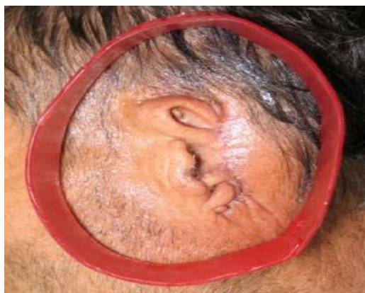
شکل ۱- قالب‌گیری از ناحیه ضایعه

۱- قالب‌گیری اولیه از ناحیه ضایعه در گوش سمت چپ و گوش سمت راست با ماده هیدروکلوئید برگشت ناپذیر (Alginate; Zhermack, SpA, Badia Plesine, Italy) انجام شد. موهای سر بیمار با وازلین تا حد امکان کنار زده شد و در اطراف ناحیه گوش، با موم یک باکس با ارتفاع ۷ سانتی‌متری تعبیه شد (شکل ۱). بعد از قرار دادن ماده قالب‌گیری و قبل از سخت شدن کامل ماده آلژینات، برای ایجاد گیر از تکه‌های کوچک گاز استفاده گردید. سپس گچ سریع سخت شونده نوع یک (پارس دنتال، تهران-ایران) روی آلژینات قرار داده و بعد از سخت شدن آن، قالب برداشته شد.