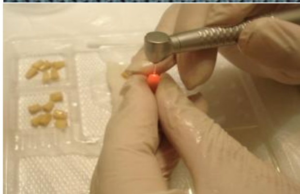
شکل ۱- تیپ‌های G6 لیزر Er, Cr:YSGG و آماده‌سازی حفرات انتهای ریشه توسط این لیزر

عاجی حفرات رتروگرید گردد و بدین ترتیب به گیر بهتر و همچنین ایجاد سیل مناسب تر کمک نماید (۱۷). طبق مطالعات صورت گرفته بر روی CEM cement، این ماده از قدرت سیلان (Flow) بیشتری نسبت به MTA برخوردار است (۱۸)، بنابراین ممکن است بیشتر بتواند به بی‌نظمی‌های ایجاد شده در سطوح عاجی دیواره حفره انتهای ریشه و همچنین توبول‌های عاجی باز نفوذ نماید.