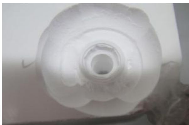
شکل ۱- ساخت نمونه‌های Copy-milled با استفاده از بلوک‌های زیر کونیایی

به ترتیب استفاده عبارت بودند از: 0.3C, 1XL, 2U, 0.48A, 1.6A, 0.6A, 2A, 4L. پس از اینکه نمونه الگو روی صفحه اسکن دستگاه با چسب ثابت شدند، بلوک زیر کونیایی شماره ۱۶ در سمت دیگر قرار گرفت و تراش اباتمنت‌ها در داخل بلوک توسط فرزهای تراش انجام شد (شکل ۱). سپس اباتمنت‌های تراش خورده برای اینکه رنگ موردنظر را پیدا کنند، در محلول Color covering گذاشته شدند. سپس زیر نور Red Lamp خشک شده و جهت Sintering در کوره با درجه حرارت ۱۵۰۰ درجه سانتی‌گراد به مدت ۸ ساعت قرار گرفتند (۲۱).