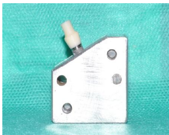
شکل ۲- مانت نمونه‌ها در جیگ اختصاصی با زاویه ۳۰ درجه