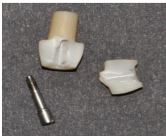
شکل ۳- شکست ناحیه اتصال در گروه Copy-milled