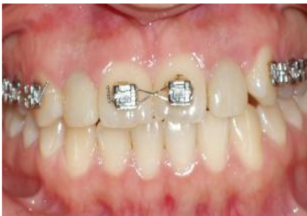
شکل ۱۱- وضعیت نسج نرم پس از سپری شدن ۲ هفته

بعد از گذشت یک هفته از بستن Healing اباتمنت‌های Flared، بیمار فرا خوانده شد و اباتمنت‌ها باز شدند. لثه تا حدودی Recontour شده بود. رستوریشن‌های کامپوزیتی در دهان تنظیم شدند، کانتور مناسب در ناحیه لثه ایجاد شد و بعد از ارزیابی تماس‌های پروگزیمال و اکلوزال، سطح کامپوزیتی رستوریشن‌های موقتی پالیش و رستوریشن‌ها با ۳۰ N torque پیچ شدند و سوراخ پیچ که در ایمپلنت سمت راست در لبه انسیزال و در سمت چپ پالاتالی بود با همان کامپوزیت لایت کیور سیل شد (شکل ۱۰). پس از گذشت دو هفته با توجه به ایجاد کانتور مناسب لثه و پاپی‌های بین‌دندانی (شکل ۱۱)، ابتدا یک قالب آلژیناتی از فک بالا با حضور رستوریشن‌های موقتی تهیه و سپس قالب‌گیری غیرمستقیم مجدد از فیکسچرها و کانتور جدید لثه با استفاده از رستوریشن‌های موقتی در نقش کوپینگ‌های قالب‌گیری انجام شد، کست نهایی بلافاصله ریخته شد و رستوریشن‌ها به دهان بیمار منتقل گردید. در لابراتوار با کمک ایندکس سیلیکونی ساخته شده روی کست