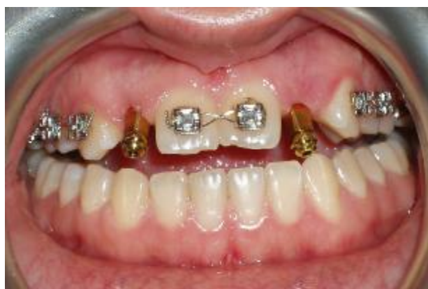
شکل ۶- کویپنگ های قالب گیری

جهت اطمینان از گیر کافی کامپوزیت به اباتمنت های پلاستیکی، در سطح اباتمنت ها به وسیله فرز خشونت ایجاد شد. سپس در لابراتوار کامپوزیت لایت کیور (Spectrum, Dentsply, Germany) با رنگ