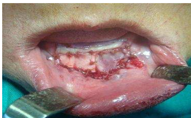
بیمار ۱- بلافاصله پس از جراحی

مزیت اولیه Alloderm نسبت به آلوگرفت‌های قبلی شامل عدم حضور هرگونه سلول که توانایی بالقوه انتقال ویروس‌ها را دارد و عدم حضور کمپلکس تطابق بافتی کلاس I و II مربوط به رد پیوند می‌باشد (۴). در مطالعه مشابه که توسط Sezar و همکاران (۹) جهت مقایسه پیوندهای مخاطی اتوزن با آلوگرفت‌های Collagen-based و Solvent-preserved در وستیبولوپلاستی انجام شد، شش بیمار در هر یک از گروه پیوندهای فوق قرار داده شدند. در تعیین حجم نمونه این مقاله از تفاضل میانگین عمق وستیبول و انحراف معیار قبل از جراحی و ۶ ماه بعد از آن در گروه Autogenous graft و Allograft استفاده گردید و بدین صورت تعداد نمونه‌ها به صورت ۱۰ بیمار زوجی برآورده شد. بدین صورت با حذف عوامل مخدوش‌کننده امکان مقایسه هر فرد با خودش فراهم گردید.