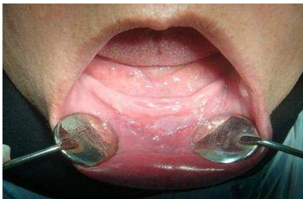
بیمار ۱- ۳ ماه پس از جراحی

در مطالعه Sezar و همکاران (۹) همه بیماران تحت جراحی وستیبولوپلاستی کلارک قرار گرفتند. ما نیز در این مطالعه این روش جراحی را بعلت انقباض کمتر اسکار انتخاب کردیم (۱۰). هیچ تفاوت آماری معنی‌داری در ناحیه وستیبولار افزایش یافته (ایجاد شده طی جراحی) و میزان Relapse بین آلوگرفت‌های Dura mater و Fascia lata و پیوندهای مخاطی پالاتالی در مطالعه Sezar مشاهده نشد و این درحالی بود که بازگشت ناحیه وستیبولار ایجاد شده با Fascia lata بیشتر از دو روش دیگر رخ داد.