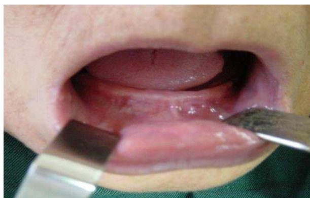
بیمار ۱- قبل از جراحی