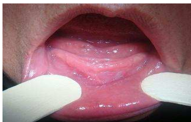
بیمار ۱- یکماه پس از جراحی

در مطالعه Sezar و همکاران (۹) همه بیماران تحت جراحی وستیبولوپلاستی کلارک قرار گرفتند. ما نیز در این مطالعه این روش جراحی را بعلت انقباض کمتر اسکار انتخاب کردیم (۱۰). هیچ تفاوت آماری معنی‌داری در ناحیه وستیبولار افزایش یافته (ایجاد شده طی جراحی) و میزان Relapse بین آلوگرفت‌های Dura mater و Fascia lata و پیوندهای مخاطی پالاتالی در مطالعه Sezar مشاهده نشد و این درحالی بود که بازگشت ناحیه وستیبولار ایجاد شده با Fascia lata بیشتر از دو روش دیگر رخ داد.