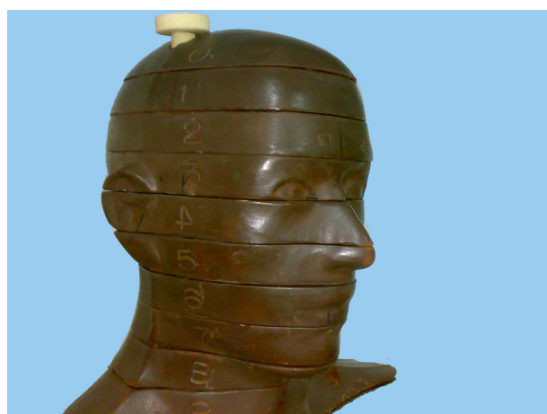
شکل ۱- فانتوم RANDO

به خاطر مقادیر نسبتاً کم اشعه دریافتی در TLDها، در هر مرتبه انجام آزمایش در تکنیک‌های پانورامیک و توموگرافی خطی، بدون جا به جا کردن فانتوم و دقیقاً در همان پوزیشن، ۵ مرتبه اکسپوز و در CBCT، ۲ مرتبه اکسپوز انجام گرفت تا مقدار اشعه‌ای که به TLDها می‌رسد یک میزان قابل اندازه‌گیری در هنگام قرائت آن باشد چرا که TLDها به مقادیر کم اشعه حساسیت پایینی دارند و ممکن است خطای اندازه‌گیری افزایش یابد. اما در تکنیک CT به خاطر بالا بودن مقدار اشعه دریافتی در هر مرتبه آزمایش فقط یکبار اکسپوز انجام گردید که این کار در مقالات مشابه نیز انجام شده است (۳،۴).