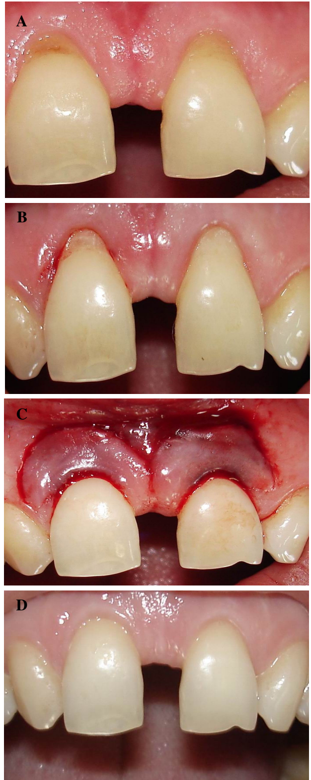
شکل ۱- مراحل جراحی Semilunar Coronally Positioned Flap (SCPF)

A: نمای پیش از جراحی ضایعات لثه بر روی لترال و کانین چپ ماگزایلا، B: Modified semilunar incision، C: فلپ کرونالی شده و بخیه، D: شش ماه پس از جراحی