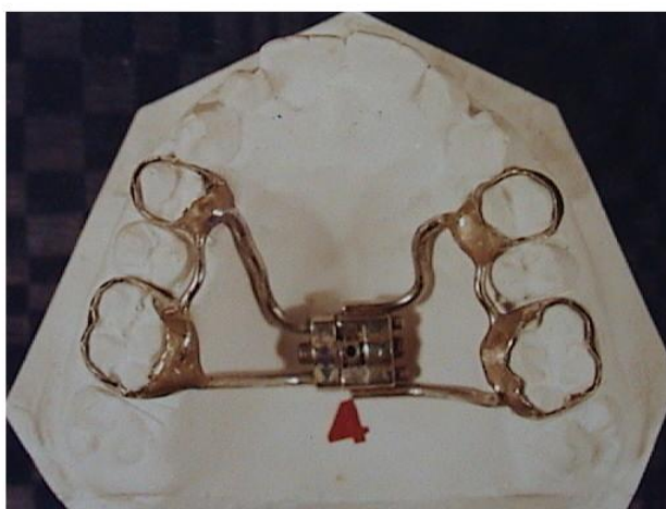
شکل ۲- دستگاه Hyrax

به تمامی بیماران در هر دو گروه توصیه شد که دستگاه خود را روزی یک (۳۶٪ بیماران) و یا دو بار (۶۴٪ بیماران) و هر بار به میزان یک چهارم دور فعال نمایند. اکسپانشن زمانی متوقف می‌شد که از نظر کلینیکی ۲ تا ۳ میلی‌متر اور اکسپانشن مشاهده می‌گردید. Sari و همکاران میزان اکسپانشن کافی را زمانی دانستند که کاسپ پالاتال مولر اول بالا روی کاسپ باکال مولر اول پایین قرار گیرد (۱۴). پس از اکسپانشن دستگاه‌های RME از دهان بیمار خارج و یک دستگاه ریتینر Hawley جهت جلوگیری از Relapse داده شد. از تمامی افراد تحت درمان در هر دو گروه دو عدد کلیشه سفالوگرام PA یکی قبل از شروع