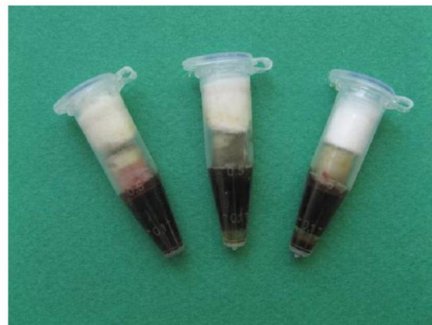
شکل ۳- قرار گیری سطح نمونه‌ها در تماس با خون

نحوه آماده‌سازی گروه‌های ۵ و ۶ مانند گروه‌های ۳ و ۴ بود با این تفاوت که مواد مورد مطالعه به جای مخلوط شدن با مایع پیشنهادی کارخانه با خون مخلوط شدند. با توجه به اینکه استاندارد در مورد مخلوط کردن این مواد با خون وجود ندارد و اینکه وزن مخصوص خون افراد مختلف متفاوت خواهد بود، تصمیم بر این شد که از حجم