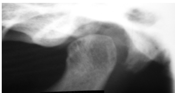
شکل ۱- تصویر ناحیه TMJ در رادیوگرافی پانورامیک با ضایعه (تصویر بالا) و بدون ضایعه (تصویر پایین)