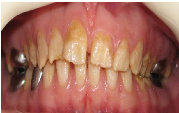
شکل ۲- آملوژنیزس ایمپرکتا نوع Hypomature

Hypomature از نوع X-linked میزان تراکم مینا طبیعی گزارش شده است (۱۹) (شکل ۲).