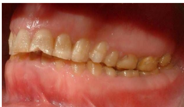
شکل ۱- آملوژنیزس ایمپرکتا نوع Hypoplastic

وجود حفرات مینایی متعدد (Pits)، سایش شدید مینایی همراه با باز شدن نقاط تماس پروکزیمالی، نمای موسوم به قله برفی (Snow-capped)، لایه نازک مینایی به رنگ زرد یا قهوه‌ای، بروز مشکل در رویش دندان‌های دائمی، وجود نهفتگی‌های متعدد و امکان تمایز مینا و عاج در کلیشه‌های رادیوگرافی (شکل ۱).