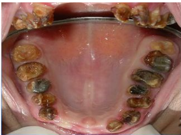
شکل ۳- آملوژنیزس ایمپرکتا نوع Hypocalcified

سایش شدید و سریع مینا بلافاصله پس از رویش دندان، حساسیت نسبت به تغییرات حرارتی، رنگ قهوه‌ای تیره در مینا، وجود ترکیبات آهکی نظیر انواع جرم و Calculus در اطراف دندان به دلیل حساسیت شدید بیمار و عدم رعایت بهداشت فردی و عدم تمایز مینا و عاج در رادیوگرافی با حداقل درصد تراکم مینایی (شکل ۳).