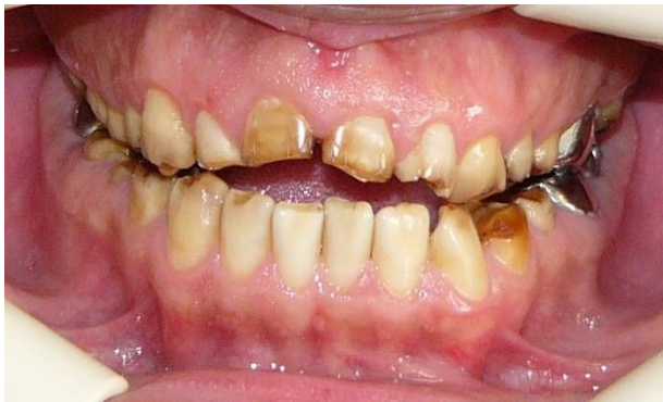
شکل ۴- نمای فرونتال قبل از درمان