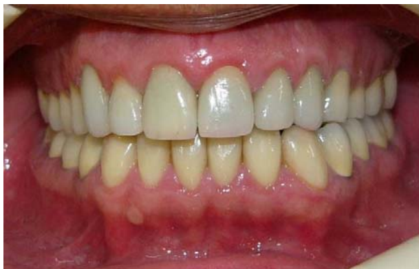
شکل ۵- نمای فرونتال پس از درمان

و Nel و همکاران در درمان بیماران AI از Porcelain veneers و Onlay Ceramics یا فلزی استفاده کرده و نشان دادند که با گذشت ۳ سال تنها دو رستوریشن با شکست مواجه شده است (۴۳). Kostoulas و همکاران در یک بیمار ۲۴ ساله مبتلا به AI که دچار هیپوپلازی در تمام دندان‌های خود بود از لامینیت‌های چینی در دندان‌های قدامی و روکش‌های تمام سرامیک در دندان‌های خلفی استفاده کردند (۱۸). در مطالعه این محقق درمان ترمیمی پس از جراحی لثه صورت گرفت و پس از شش ماه پیگیری مشکل عمده‌ای به چشم نمی‌خورد.