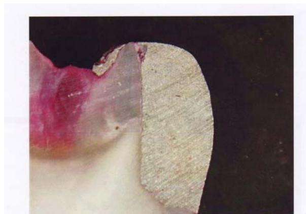
شکل ۱- نمایی از تاج دندان برش داده شده زیر میکروسکوپ (نفوذ رنگ بین ترمیم و سطح دندان فراتر از DEJ مشاهده می‌گردد).

جهت مقایسه گروه‌ها از نظر نفوذ رنگ از سطح ژنژیوال و اگزیزال از تست Kruskal-Wallis و جهت تبیین اینکه این تفاوت آماری بین کدامیک از گروه‌ها وجود دارد مقایسه چندگانه (Scheffe) انجام شد.