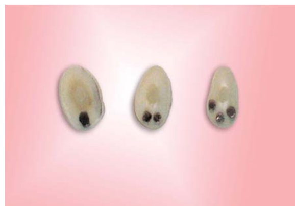
شکل ۲- قسمت های تاجی، میانی و انتهایی ریشه به ترتیب از سمت چپ

کرونا، یک سوم تاجی، یک سوم میانی و یک سوم انتهایی نام‌گذاری شد. برای شناسایی این قطعات از هم روی سطح اپیکال هر قطعه یک علامت زده شد (شکل ۲).