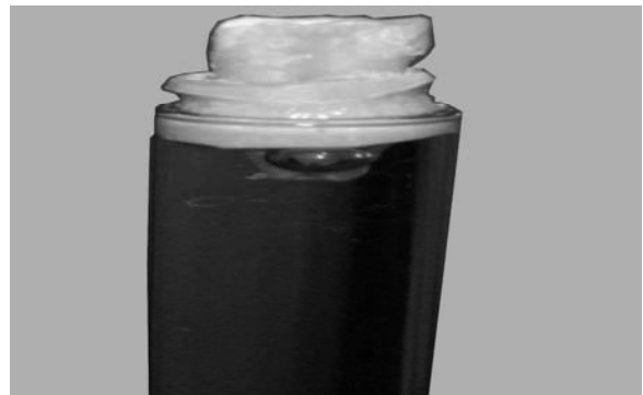
شکل ۲- مجموعه ریشه و آکريل قرار گرفته در لوله حاوی محیط کشت

جهت استریل نمودن نمونه‌ها، مجموعه لوله‌های آزمایش و آکريل و دندان در اتوکلاو قرار گرفتند.