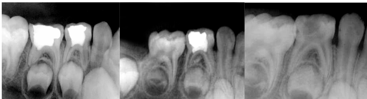
الف شکل ۳ الف- رادیوگرافی درمان به روش MTA: موفقیت درمان عکس اولیه ب- رادیوگرافی درمان به روش MTA: موفقیت درمان پیگیری سه ماهه ج- رادیوگرافی پالپوتومی موفقیت MTA پس از شش ماه