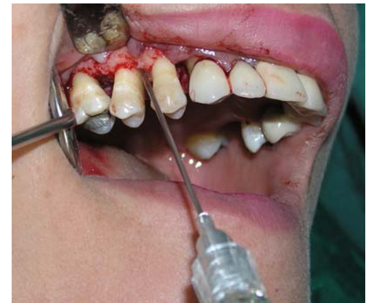
ه- تزریق Emdogain در داخل ضایعه استخوانی