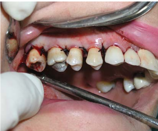
ی- برگرداندن فلپها و Suture کردن آنها