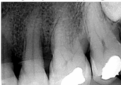
د- تصویر RVG سه ماه بعد از جراحی