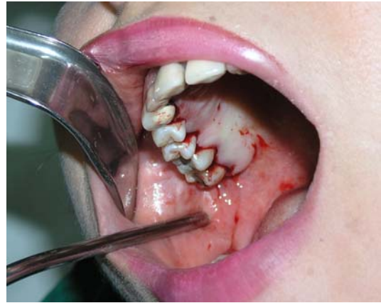
الف- برش سالکولار در پالاتال