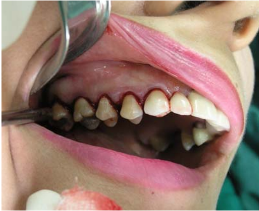
ب- برش سالکولار در بایکال