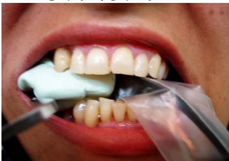
ب- sensor و template با XCP در دهان بیمار