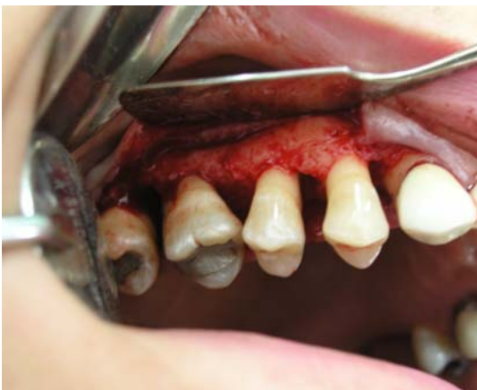
د- دبریدمان کامل ضایعه استخوانی