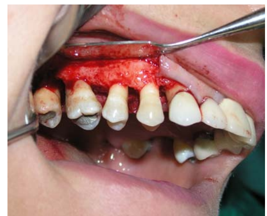
ج- بلند کردن فلپ موکوپریوستال