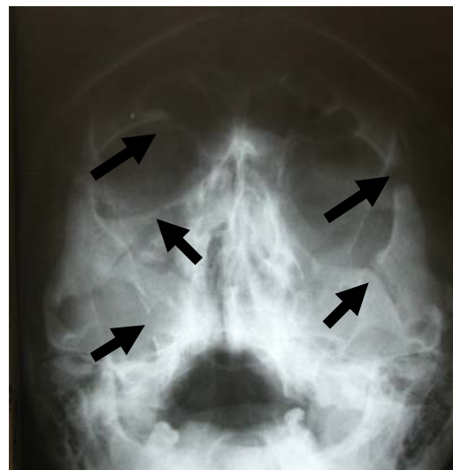
شکل ۱- رادیوگرافی واترز، فلشها محل شکستگیها را نشان می‌دهد

اطلاعات مربوط به هر بیمار در فرم اطلاعاتی تهیه شده ثبت و یافته‌ها توسط نرم افزار SPSS مورد بررسی قرار گرفت، سپس حساسیت و ویژگی نواحی چپ و راست ناحیه اوربیت، گونه و سینوس ماگزایلا در هم ادغام و به صورت یک عدد کلی بیان شد.