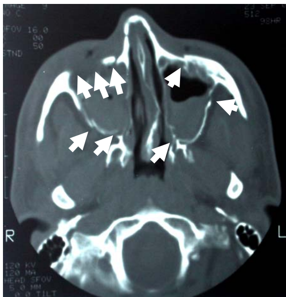
شکل ۳- مقطع اکزیال از CT اسکن بیمار، مناطق شکستگی با فلش مشخص شده است

اطلاعات مربوط به هر بیمار در فرم اطلاعاتی تهیه شده ثبت و یافته‌ها توسط نرم افزار SPSS مورد بررسی قرار گرفت، سپس حساسیت و ویژگی نواحی چپ و راست ناحیه اوربیت، گونه و سینوس ماگزایلا در هم ادغام و به صورت یک عدد کلی بیان شد.