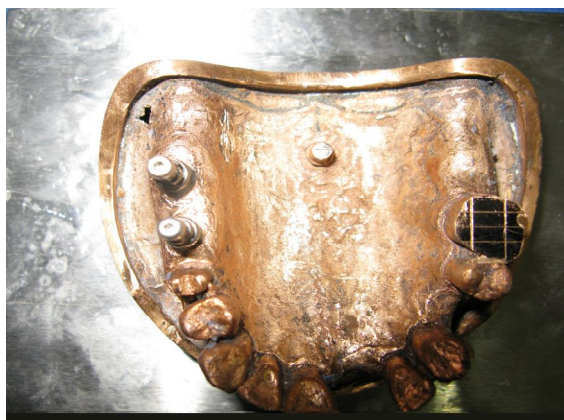
شکل 1- کست مرجع تهیه شده

یک رفرنس فلزی به عنوان مرجع اندازه‌گیری وجود داشت. با هیدروکلونید غیرقابل برگشت (Alginoplast; Heraeus Kulzer, Hanau, Germany) از مدل درحالی که ترانسفر کوپینگ‌های مربوط به قالب‌گیری تری بسته بر روی آن بسته شده بود قالب تهیه شد. بدین ترتیب کستی ساخته شد که تری اختصاصی از آن به دست آمد. برای ساخت تری اختصاصی جهت قالب‌گیری از دندان به تنهایی، بدون وجود کوپینگ‌ها قالب‌گیری انجام شده و تری اختصاصی ساخته شد. کست‌ها با دو لایه موم بیس پلنت (Modelling Wax; Dentsply, Weybridge, UK) پوشانده شد تا ضخامت کافی ماده قالب‌گیری پلی‌اتر فراهم گردد و به علاوه 3 استاپ بافتی در آن تعبیه شد تا موقعیت قرارگیری تری در هنگام تهیه قالب و نیز ضخامت ماده قالب‌گیری استاندارد باشد. با استفاده از نرم‌افزار Mini tab حجم نمونه 9 عدد در هر گروه برای مطالعه حاضر تعیین گردید.