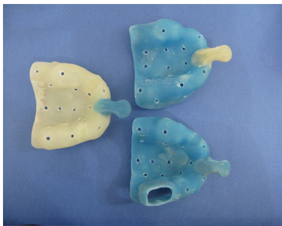
شکل 2- تری‌های اختصاصی به صورت تری باز و تری بسته تهیه شده

بین مطالعاتی که در مورد تکنیک قالب‌گیری بررسی کرده‌اند، Carr (1991) دو تکنیک مستقیم و غیرمستقیم را روی 5 مدل ایمپلنت مورد بررسی قرار داد و نتیجه گرفت که در روش مستقیم (Direct transfer) دقت بسیار بیشتری روی کست نهایی به دست می‌آید (8). در سال 2001 Daoudi و همکاران دقت 4 روش قالب‌گیری را با استفاده از 2 ماده قالب‌گیری متفاوت مطالعه کردند (15). نتایج تفاوت‌های زیادی را در مقایسه تکنیک قالب‌گیری Repositioning با تکنیک Pick up نشان دادند. در سال 2008 Lee و همکاران (16) در یک مطالعه مروری که با هدف بررسی دقت تکنیک‌های مختلف قالب‌گیری و نیز فاکتورهای مؤثر در دقت قالب‌گیری از ایمپلنت انجام شد، نتایجی به شرح ذیل ارائه کردند: از میان حدود 14 مطالعه که دقت قالب‌گیری به روش Pick و Transfer را بررسی کرده بودند 5 مطالعه 3 یا تعداد کمتری ایمپلنت را مورد استفاده قرار داده بودند؛ 4 مطالعه تفاوتی بین تکنیک Transfer و Pick up پیدا نکردند؛ 9 مطالعه مقایسه این دو تکنیک را وقتی که 4 یا تعداد بیشتری ایمپلنت مورد استفاده قرار گرفته بودند بررسی کردند که 5 تا از آنها دقت بیشتری را در تکنیک Pick up و یکی در تکنیک Transfer نشان دادند و 3 مطالعه تفاوتی بین دو تکنیک نشان ندادند. هدف از انجام این مطالعه، بررسی دقت ابعادی و زاویه‌ای دو تکنیک قالب‌گیری تری باز و تری بسته و دقت ثبت جزئیات سطحی با استفاده از ماده قالب‌گیری پلی‌اتر بود.