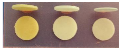
شکل ۳- نمونه‌های لامینیت و پس‌زمینه

دیسک‌های لامینیت به سه گروه ده تایی تقسیم شدند (گروه اول A، گروه دوم B و گروه سوم C) و به نمونه‌های هر گروه شماره‌ای از ۱ تا ۱۰ تعلق گرفت. دیسک‌های پس‌زمینه نیز به سه گروه تقسیم شدند. در گروه اول (از شماره A11 تا A20) دیسک‌های پس‌زمینه با رنگ A2 قرار گرفتند و دو گروه بعد نیز (B11 تا B20 و C11 تا C20) شامل دیسک‌های تغییر رنگ یافته بودند.