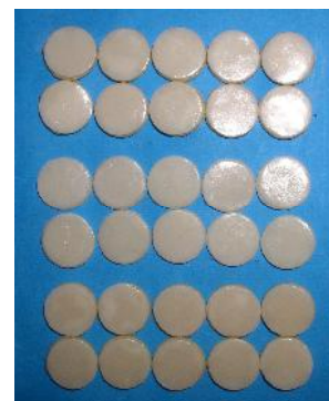
شکل ۴- نمونه‌های آماده شده پس از سیمان کردن لامینیت با پس‌زمینه

انتخاب ضخامت ۱ میلیمتری از سیمان با این فرض بود که در نمونه‌های کلینیکی یعنی دندان، نقطه تغییر رنگ‌یافته بیش از نقاط دیگر تراش داده می‌شود و از این فضا با کمک سیمان و shade modifier برای خنثی کردن رنگ استفاده می‌گردد. تعداد ۳۰ نمونه تهیه شده (شکل ۴) جهت ثبت ابعاد رنگ توسط دستگاه اسپکتروفوتومتر با شرایط ذکر شده قبلی، مورد بررسی قرار گرفتند. (به هر نمونه در این حالت شماره از ۲۱ تا ۳۰ در گروه مربوطه تعلق گرفت). لازم به یادآوری است که سطح همه نمونه‌ها در هر یک از مراحل قبل از خوانده شدن توسط دستگاه، با الکل سفید پاک شد تا آلودگیهای سطحی نمونه‌ها نتیجه را مخدوش ننماید.