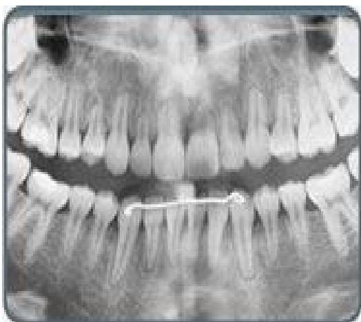
پس از درمان