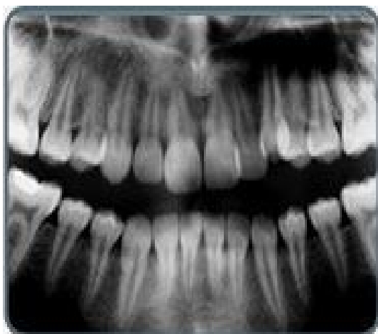
شکل 2- تحلیل اپیکالی دایمی ریشه ناشی از درمان ارتودنسی قبل از درمان

تحلیل ریشه طی درمان ارتودنسی می‌تواند به صورت یاتروژنیک حادث شود. تحلیل ریشه به دو گروه قابل تقسیم است. در تحلیل ایدیوپاتیک لاکونا‌های تحلیلی در تمام سطح ریشه به ویژه یک سوم اپیکالی و میانی با عمق 1 میلی‌متر مشاهده می‌شود (شکل 1). به دنبال قطع اعمال نیرو عمده این لاکوناها با سمان ترمیمی پر می‌شود. در تحلیل اپیکالی که موضوع مورد بحث در اکثر مقالات است حذف قسمتی از سمان و عاج انتهای اپکس ناشی از اعمال نیروی ارتودنسی اتفاق می‌افتد. بازسازی بخش از دست رفته ریشه تقریباً غیرممکن است و بهترین راه ممانعت از آن کنترل فاکتورهای بیومکانیکال دخیل در ایجاد تحلیل ریشه می‌باشد (1) (شکل 2).