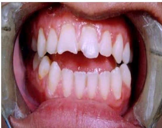
شکل 2 (A) - فوتوگرافی داخل دهانی قبل از درمان