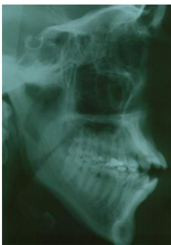
شکل 2 (C) - سفالومتری قبل از درمان

Lingual root torque بر روی دندان‌های قدامی فک بالا، قرار دادن Lingual crown torque در دندان‌های خلفی فک پایین و ایجاد Active labial crown torque در دندان‌های قدامی فک پایین انجام شد.