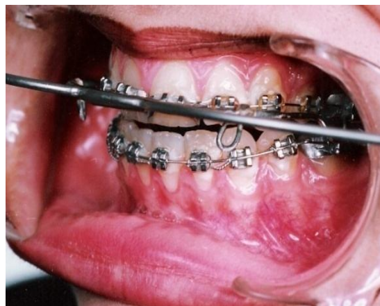
شکل 1 - LAHP در دهان

Lingual root torque بر روی دندان‌های قدامی فک بالا، قرار دادن Lingual crown torque در دندان‌های خلفی فک پایین و ایجاد Active labial crown torque در دندان‌های قدامی فک پایین انجام شد.