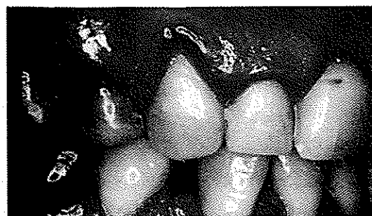
قبل از عمل دندان ۳