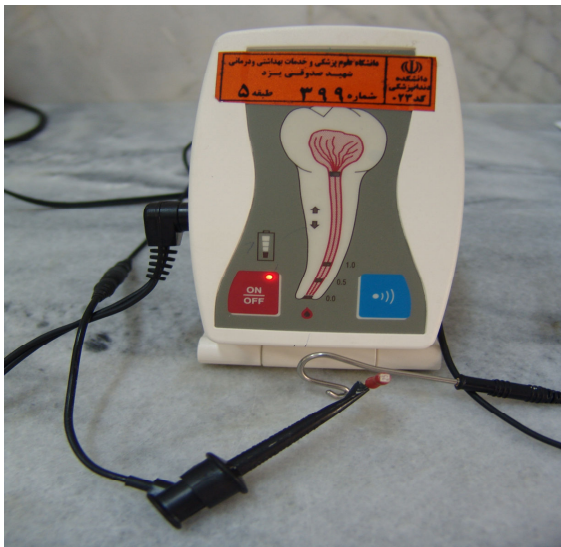
شکل ۱- دستگاه Novapex

بافت پالپ داخل اتاقک پالپ وجود داشت به کمک اسکواوتور (Excavator) و یا فرز روند کارباید توسط انگل با دور کم (Low speed) حذف شد و پس از ایزوله کردن دندان با رابردم و کلمپ، ناحیه پالپ چمبر با نرمال سالین شستشو داده شد و پس از خشک کردن مدخل کانال برای هر دندان یک اندکس ثابت انسیزالی در نظر گرفته شد. Apex locatorهای مورد استفاده در این تحقیق (Novapex (VDW GmbH) (شکل ۱) و Root ZX (Dentaport-us) بود (شکل ۲).