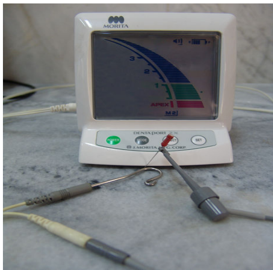
شکل ۲- دستگاه Root ZX

دقت کافی برخوردار نیستند. اما نسل آخر این دستگاه‌ها با امپدانس متغیر در مقایسه با نسل‌های پیشین مزایای فراوانی دارند (۱۳). تحقیقات فراوانی برای ارزیابی دقت این وسایل انجام گرفته است که میزان دقت آنها را تا حدود ۹۰٪ نشان داده است (۱۸-۵،۱۴). مطالعه Dunlap و همکاران (۱۹۹۸) دقت دستگاه Root ZX را در کانال‌های زنده و غیر زنده مورد بررسی قرار داد و نشان داد که از نظر آماری تفاوت معنی‌داری در این کانال‌ها وجود ندارد و میزان دقت دستگاه ۸۲/۳٪ می‌باشد (۱۹). همچنین مطالعه Plotino و همکاران (۲۰۰۶) میزان موفقیت این دستگاه را ۹۴/۲۸ درصد گزارش کرده است (۲۰) و مطالعه D'Assunção و همکاران (۲۰۰۷) میزان دقت دستگاه Root ZX را ۹۷/۴۴٪ نشان داده است (۲۱). همچنین D'Assunção و همکاران (۲۰۰۶) در یک مطالعه in vitro گزارش نموده‌اند بین دقت دستگاه‌های Root ZX و Novapex اختلاف معنی‌داری وجود ندارد و هر دو این دستگاه‌ها می‌توانند با دقت بالا در تعیین طول کانال به کار روند (۲۲).