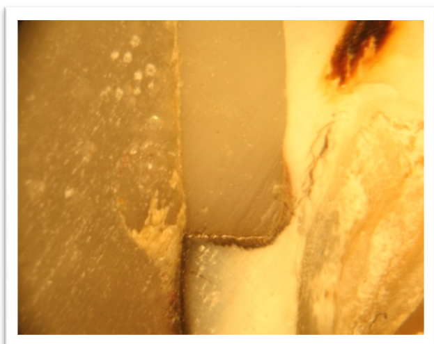
شکل ۴- نفوذ ردیاب (grade=۳)