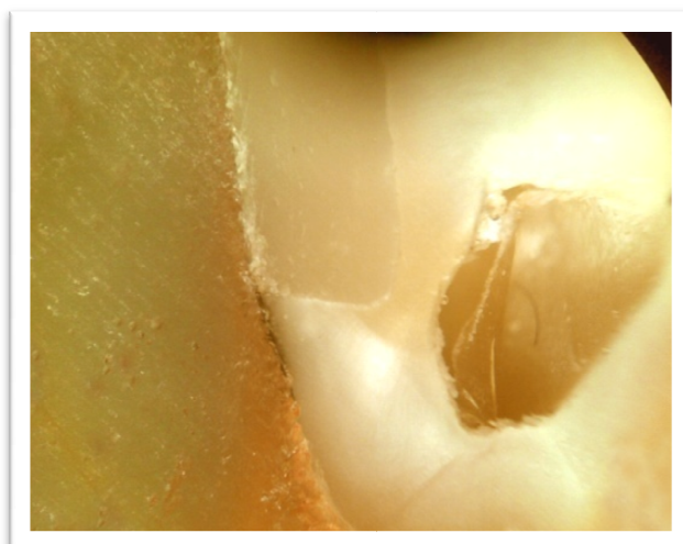
شکل ۱- عدم نفوذ ردیاب (grade=۰)