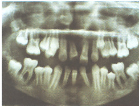
تصویر ۱- وضعیت کلینیکی و رادیوگرافیک نسوج پریودنتال بیمار در معاینه اولیه