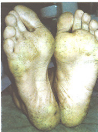
تصویر ۲- نمای کلینیکی هیپرکراتوز کف دست و پای بیمار

آگرانولوسیتوز ژنتیکی نوزادان، بیماری ذخیره‌ای گلیکوژن و سندرم اهلر- دانلس انواع ۴ و ۸ (۵،۴).