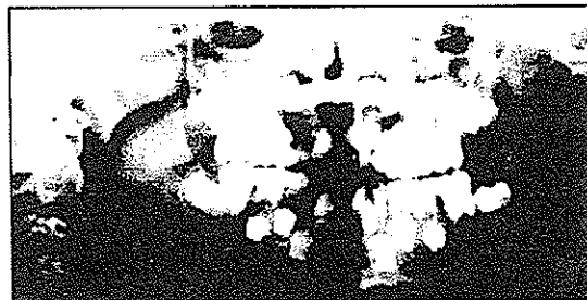
تصویر ۳- رادیوگرافی OPG بیمار- به ریشه‌های کوتاه و پالپ چمبر هلالی شکل و پالپ کانال مسدود توجه شود.