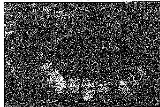
تصویر ۲- کمبود فضای موجود در فک پایین و رنگ کهربایی دندانها و تجمع جرم دندانی