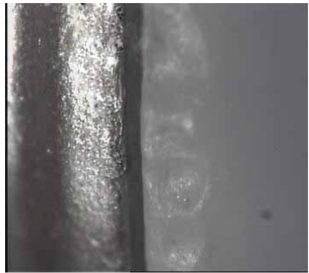
شکل ۴- تصویر تهیه شده از لبه کور و مدل آزمایشی توسط استریومیکروسکوپ