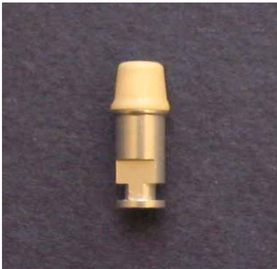
شکل ۱- کور ساخته شده که به طور کامل روی مدل آزمایشی نشسته است.

برای نشاندن کوره‌های تهیه شده روی مدل آزمایشی، از یک اسپری مخصوص به نام Arti Spray (طبق دستورالعمل کارخانه) استفاده شد. بدین ترتیب که داخل کور یک لایه از این اسپری زده شد و سپس کور روی مدل آزمایشی قرار گرفته و تمام نقاطی که در سطح داخلی کور از ورای اسپری مشخص بودند، به عنوان نقاط ممانعت‌کننده از نشست کامل، توسط هندپیس با سرعت بالا و فرز روند ریزالماسی با خط آبی حذف شدند. این عمل تا نشست کامل کور ادامه یافت (شکل ۱).