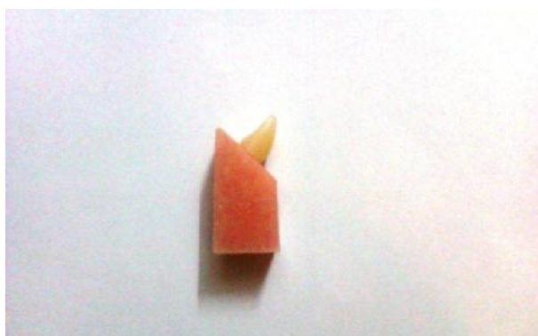
شکل ۲- نمونه آماده شده

شبه‌سازی محیط دهانی با انجام ترموسایکلینگ (ایجاد حرارت و رطوبت مشابه محیط دهان) و Cyclic loading (اعمال نیروهای جویدن) انجام نشده است که ما در تحقیق حاضر مدنظر قرار داده‌ایم (۱۷). با توجه به کاستی‌های فوق و اظهارات کارخانه‌های سازنده دندان مصنوعی کامپوزیتی مینی بر بیشتر بودن زیبایی این دندان‌ها و قابل مقایسه بودن سایش آنها با دندان‌های آکریلی، این تحقیق با هدف مقایسه تأثیر ۴ نوع دندان مصنوعی (دندان‌های کامپوزیتی (مولتی‌لیتیک) و آکریلی (مونولیتیک) Ideal makoo و Ivoclar) با و بدون Cyclic loading بر میزان استحکام باند در آکریل بیس دنچر خودبه‌خود پلیمریزه شونده در بخش پروتز متحرک دانشکده دندانپزشکی دانشگاه آزاد اسلامی طراحی و اجرا شد. با امید به این که نتایج این تحقیق در انتخاب نوع دندان و آکریل بیس مفید واقع شود.