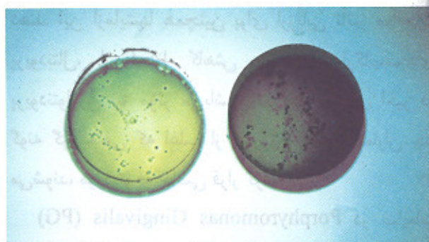
تصویر شماره ۳- کشت‌های تهیه شده در محیط ژلوز خوندار (راست) و محیط TSBV (چپ)

بررسی میکروبیولوژیک نمونه‌گیری به عمل آمد که وجود Aa در ۸۶/۷٪ بیماران (۱۳ بیمار) مثبت و در ۱۳/۳٪ بیماران (پس از ۲ بار نمونه‌گیری) منفی گزارش شد. از ۶۰ ناحیه نمونه‌برداری Aa در ۴۸/۳٪ نواحی