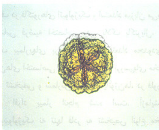
تصویر شماره ۲- نمای میکروسکوپی کلنی Aa