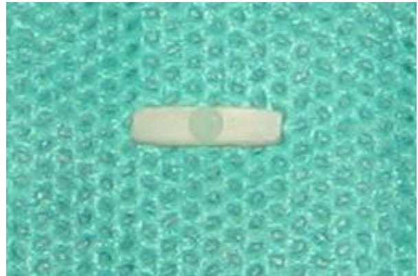
شکل ۲- نمونه‌های بعد از برش به صورت میله‌هایی بودند که کور کامپوزیتی در دو طرف و پست در مرکز قرار دارد.

(Isomet Saw, Buehler LTD, Lake Bluff, USA) استفاده شد. تمامی نمونه‌ها با سرعتی یکسان تحت خنک‌کننده آبی برش داده شدند. جهت قرارگیری نمونه‌ها در دستگاه برش عمود بر تیغه بود تا بتوان برشهایی عرضی از هر نمونه به دست آورد و در نهایت ۴ برش هریک به ضخامت ۱ میلی‌متر از هر نمونه اولیه حاصل شد. بدین ترتیب ابعاد نهایی نمونه‌ها ۱×۲×۹ میلی‌متر بود (اشکال ۲ و ۳).