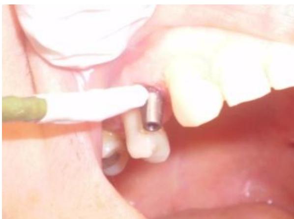
شکل ۲- باقیمانده طول سنسور با عایق مخصوص سیستم پوشانده شد و از اباتمنت سوراخ شده عبور می‌کند

قسمت سرویکال فضای داخل آن قرار داشته باشد، سنسور در خارج از دهان بیمار، یک بار از روی اباتمنت اندازه‌گیری شده و یک بار دیگر نیز، از داخل سوراخ تعبیه شده اباتمنت متصل به یک نمونه ایمپلنت عبور داده و اندازه‌گیری شد. هنگام آزمایش روی بیمار، سنسور از داخل اباتمنت ایمپلنت عبور کرده و اگر تا علامتی که قبلاً روی سنسور پیش‌بینی شده بود، داخل اباتمنت متصل به ایمپلنت قرار می‌گرفت، محل صحیح سنسور تأیید می‌شد (شکل ۲). سپس باقیمانده طول سنسور با عایق مخصوص سیستم پوشانده شد. هنگام انجام آزمایش اباتمنت بدون پیچ قرار داده شد و دسترسی پیچ در سطح فوقانی اباتمنت توسط ماده پانسمان سیل شد برای اطمینان کامل از دقت سنسور اصلی متصل به دستگاه ترمومتر آزمایشات زیر انجام شد.