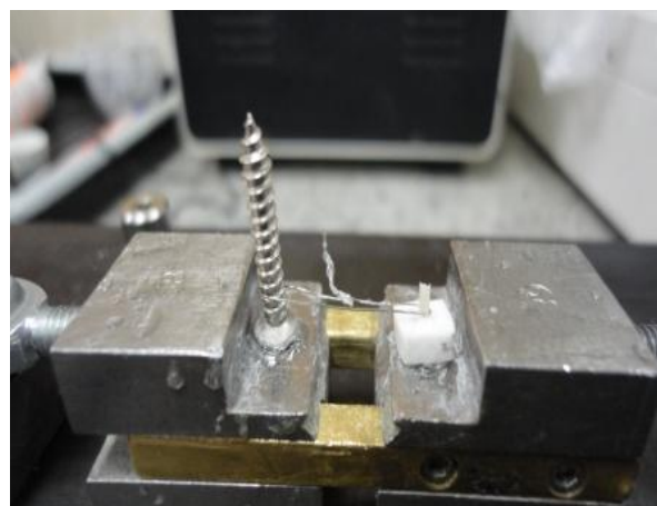
شکل ۴- حلقه در یک سو در دور استوانه کامپوزیتی قرار داده شد به نحوی که تقریباً با نیمی از محیط استوانه در تماس باشد

بین دو حمام آب 50^\circ\text{C} و 55^\circ\text{C} درجه سانتی‌گراد حرکت کردند، فاصله بین دو حمام 15 ثانیه و مدت زمانی که در هر حمام قرار می‌گرفتند 30 ثانیه بود. سپس نمونه‌ها جهت انجام تست ریزبرشی به دستگاه (EZ-Test-500N, Shimadzu, Universal testing machine (Kyoto, Japan) با استفاده از چسب سیانو آکریلات (ZapIt, Dental Ventures of America, Corona, CA, USA) متصل شدند. باند برشی در این مطالعه به روش Wire and Loop اندازه‌گیری شده است. Loop با استفاده از سیم ارتودنسی به قطر 0.2 میلی‌متر تهیه شد. این حلقه در یک سو در دور استوانه کامپوزیتی قرار داده شد به نحوی که تقریباً با نیمی از محیط استوانه در تماس باشد، در طرف مقابل، سیم در دور میله‌هایی قرار داده شده که به همین منظور تعبیه شده بودند. اتصال بین استوانه، سیم و میله‌ها طوری انجام شد که خط اصلی بین این سه جزء تست در یک راستا قرار گیرد (شکل ۴).