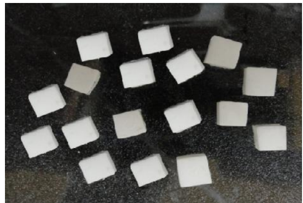
شکل ۱- بلوک‌های پیش‌ساخته سینتر شده از دو نوع کور زیرکونیایی سفید رنگ

بلوک‌های پیش‌ساخته سینتر شده از دو نوع کور زیرکونیای سفید رنگ Cercon و Zir Konzahn (Gais, Bruneck, Italy) به ابعاد 3 \times 7 \times 30 \text{ mm}^3 در رزین پلی‌استر مانیت گردید. سپس این بلوک‌ها توسط دستگاه Low speed diamond saw (لبه برنده تیغه از جنس الماس و ضخامت آن 0.5 میلی‌متر بود) برش خوردند (شکل ۱). با انجام برش تعداد ۲۴ نمونه از هر دو نوع کور زیرکونیایی با ابعاد 3 \times 7 \times 7 \text{ mm}^3 تهیه شد. نمونه‌ها توسط ذرات \text{Al}_2\text{O}_3 با قطر 50 \mu\text{m} و فشار ۳ بار در فاصله ۱۰ میلی‌متر به مدت زمان ۱۰ ثانیه سندبلاست شدند، سپس نمونه‌ها به مدت ۲ دقیقه در دستگاه اولتراسونیک حاوی اتانول ۹۶٪ قرار گرفتند تا آلودگی سطحی آن‌ها حذف گردد. نمونه‌ها به ۴ گروه ۱۲ تایی تقسیم شدند، به گونه‌ای که دو گروه ۱۲ تایی Cercon و دو گروه ۱۲ تایی Zir Konzahn داشتیم. لوله‌های پلاستیکی شفاف با قطر داخلی ۱ میلی‌متر و ارتفاع ۳ میلی‌متر که توسط کامپوزیت Flow رنگ A 2 (3M ESPE, Germany) پر شده بود، توسط دستگاه لایت (Bluephase 16i, Ivoclar Vivadent, Austria) با شدت 500 \text{ mW/cm}^2 در دو مرحله ۴۰ ثانیه‌ای از دو سمت مقابل هم کیور شد و استوانه‌های کامپوزیتی با استفاده از تیغ بیستوری از داخل لوله‌های پلاستیکی خارج شدند (شکل ۲).