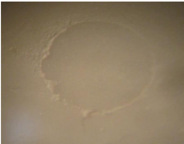
شکل ۵- بررسی نحوه شکست با استفاده از استریومیکروسکوپ

در این حالت اطمینان بیشتری از توزیع بار برشی در ناحیه اینترفاسیال وجود داشت، قبل از آغاز Load نیرو دقت شد که حلقه سیمی تا حد امکان نزدیک به ناحیه اینترفاسیال باشد. سپس نمونه‌ها در معرض نیروی برشی با سرعت ۰/۵ mm/min قرار گرفتند تا شکست اتفاق بیفتد. نیروی اعمال شده بر نمونه برحسب نیوتن از روی مانیتور دستگاه یادداشت شد و از تقسیم این نیرو بر سطح مقطع استوانه کامپوزیتی (برابر با مساحت سطح اتصال) استحکام باند ریزبرشی برحسب مگاپاسکال به دست آمد. باتوجه به مستقل بودن دو متغیر سرامیک زیرکونیایی و نوع سمان مصرفی و وابسته بودن متغیر استحکام باند ریزبرشی از روش Two-way ANOVA برای تحلیل و آنالیز داده‌ها استفاده شد. در مرحله بعد نمونه‌ها برای تعیین نحوه شکست با استفاده از استریومیکروسکوپ تحت بررسی قرار گرفتند (شکل ۵).