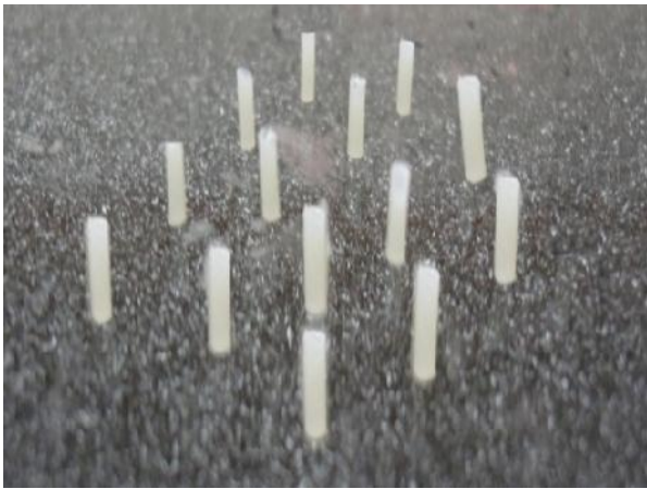
شکل ۲- استوانه‌های کامپوزیتی