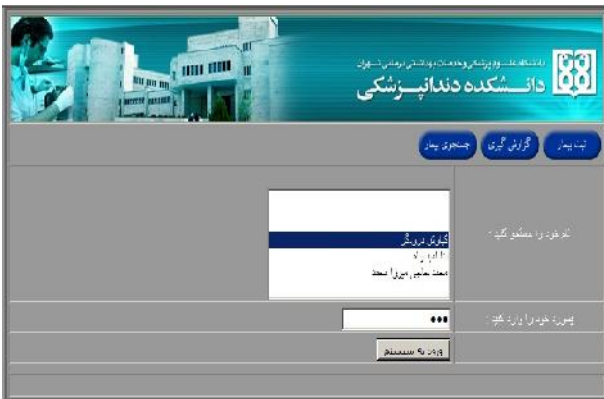
شکل ۱- صفحه Login