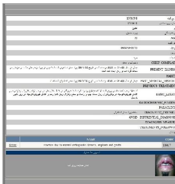
شکل ۶- نمونه‌ای از صفحه گزارش‌گیری