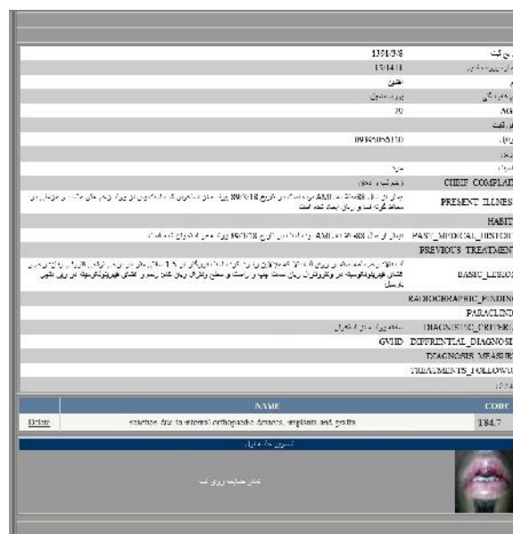
شکل ۶- نمونه‌ای از صفحه گزارش‌گیری