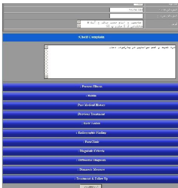
شکل ۳- نوارهای ورود داده ها براساس فرمت پرونده های بخش بیماری های دهان و فک و صورت

Agile ماکروسافت به کار رفت. برای پیاده سازی و ساخت پایگاه داده ها از موتور 2008 SQL server و برای گزارش گیری از موتور SQL reporting services استفاده شد. جهت طراحی ساختار اصلی، زبان برنامه نویسی Vb.net در محیط Visual studio 2010 که در فریم ورک Net4. پیاده سازی شده است، به کار رفت. در ابتدا عناصر اصلی سیستم آنالیز و مشخص شده و سپس نیازها و خصوصیات هر یک تعیین گردید. در مرحله بعد دیاگرام روابط آن ها (ارتباطات) رسم شده و سپس طبق خصوصیات آنالیز شده، جداول هر یک از آن ها طراحی گردید.