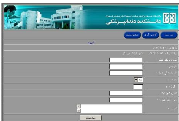
شکل ۲- صفحه ثبت داده ها