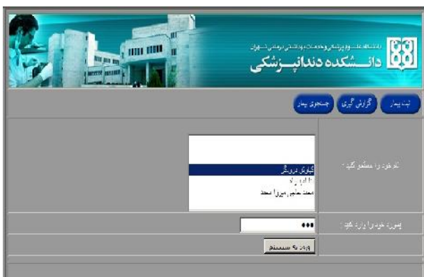
شکل ۱- صفحه Login