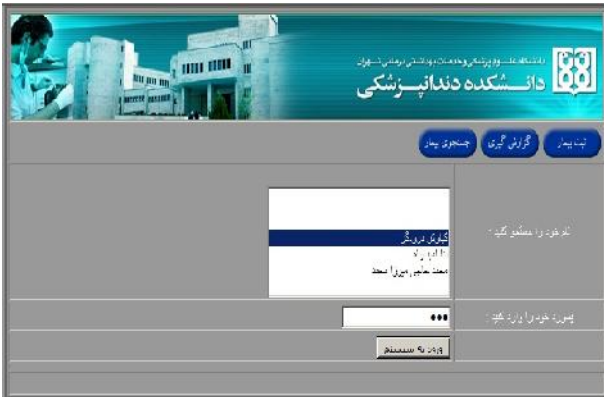
شکل ۱- صفحه Login