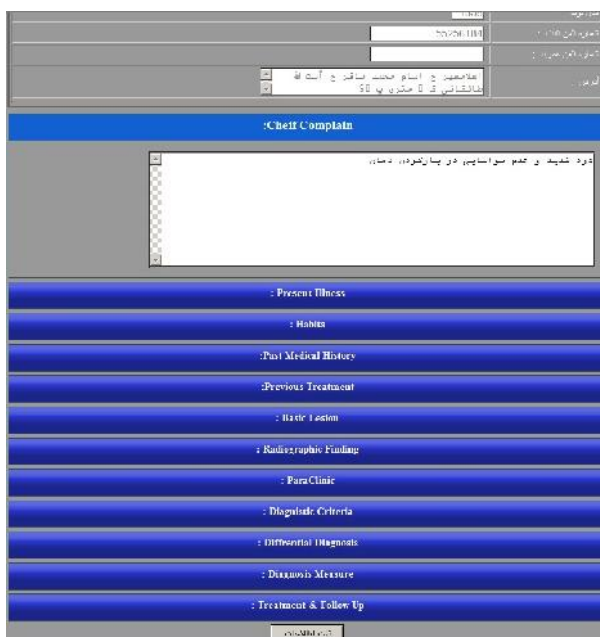
شکل ۳- نوارهای ورود داده ها براساس فرمت پرونده های بخش بیماری های دهان و فک و صورت

Agile ماکروسافت به کار رفت. برای پیاده سازی و ساخت پایگاه داده ها از موتور 2008 SQL server و برای گزارش گیری از موتور SQL reporting services استفاده شد. جهت طراحی ساختار اصلی، زبان برنامه نویسی Vb.net در محیط Visual studio 2010 که در فریم ورک Net4. پیاده سازی شده است، به کار رفت. در ابتدا عناصر اصلی سیستم آنالیز و مشخص شده و سپس نیازها و خصوصیات هر یک تعیین گردید. در مرحله بعد دیاگرام روابط آن ها (ارتباطات) رسم شده و سپس طبق خصوصیات آنالیز شده، جداول هر یک از آن ها طراحی گردید.