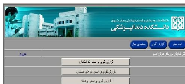
شکل ۵- صفحه گزارش‌گیری