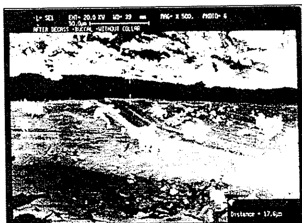
تصویر شماره ۲- تصاویر میکروسکوپ الکترونی سطح باکال نمونه‌های بدون کلار با بزرگنمایی ۵۰۰ برابر در مرحله بعد از دگاز