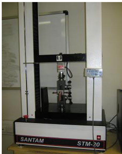
شکل ۲- دستگاه UTM