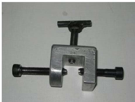
شکل ۳- گیره مخصوص نگهداری بیس آکریلی