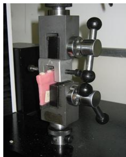
شکل ۱- تصاویر لوازم مورد نیاز برای آزمایش باندینگ توسط استاندارد

(Silane, 3M ESPE, US) و به دسته دوم مونومر (Monomer, Dental industry, Iran Acrylic, Iran polymer) زده شد. عملیات مغل‌گذاری و پخت روی آن‌ها انجام شد و دندان‌ها به آکریل (Iran acrylic polymer, Dental industry, Iran) متصل گردیدند. پس از حذف آکریل‌های اضافی و پرداخت نمونه‌ها، اتصالات هر یک از دندان‌ها به بیس آکریلی‌شان با دقت کنترل شد و در صورت بی‌نقص بودن محل چسبندگی دندان‌ها با بیس آکریلیشان برای آزمایش انتخاب شدند. تست کشش این نمونه‌ها توسط دستگاه (Santam STM-20, (UTM) Universal Testing Machine (Iran) انجام شد (شکل ۲). هر یک از نمونه‌ها به فک (گیره) (شکل ۳) دستگاه کشش ثابت شده و از طرف دیگر در جهت مخالف آن تحت تأثیر نیروی کششی توسط قلابی (شکل ۴) که فقط در لبه اینسوزالی دندان درگیر بود، با سرعتی معادل ۱ میلی‌متر بر دقیقه قرار داده شد تا زمانی که دندان در اثر نیروی وارده شکسته و یا از بیس خود خارج شد (شکل ۲). نیرویی که باعث شکست گردید، ثبت و برای تحلیل نتایج از آن‌ها استفاده شد. براساس استاندارد، جواب مثبت آزمایش هر یک از نمونه‌ها زمانی است که خود دندان و یا آکریل بیس نگهدارنده دندان بشکند ولی محل اتصال دندان با بیس آکریلی‌شان نیروی وارده را تحمل کند. جواب منفی زمانی است که محل اتصال دندان با بیس آن تحمل نیروی کششی وارده را ندارد و دندان از جایگاه خود به طور کامل خارج شود. بعد از انجام این آزمایش برای کلیه